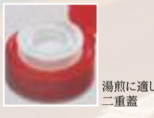
湯煎に適した二重蓋

ピンに詰めてから時間をかけて湯煎殺菌します。レトルト臭のない、本来の香りと味を生かしています。