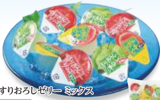
③② すりおろしゼリー ミックス