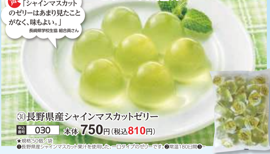
③⑩ 長野県産シャインマスカットゼリー

声「シャインマスカットのゼリーはあまり見たことがなく、味もよい。」 長崎県学校生協 組合員さん