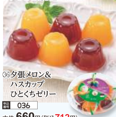
③⑥ 夕張メロン&ハスカップひとくちゼリー