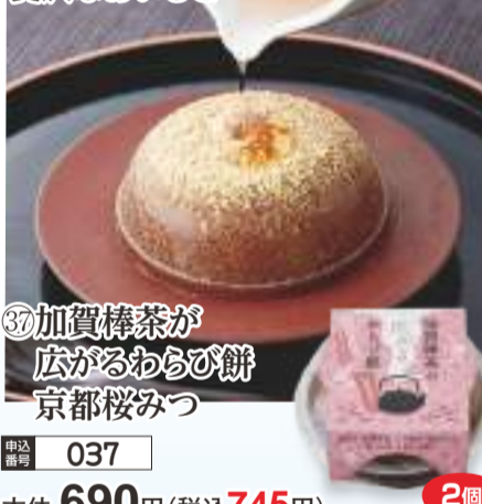
③⑦ 加賀棒茶が広がるわらび餅 京都桜みつ