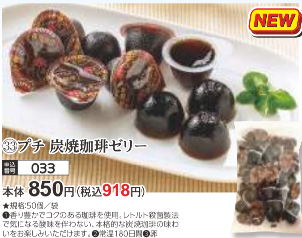
③③ プチ 炭焼珈琲ゼリー