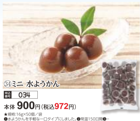
③④ ミニ 水ようかん