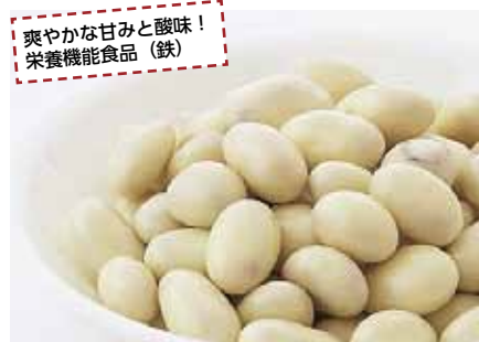
爽やかな甘みと酸味! 栄養機能食品 (鉄)