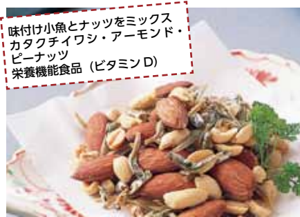
味付け小魚とナッツをミックス カタクチイワシ・アーモンド・ピーナッツ 栄養機能食品 (ビタミンD)