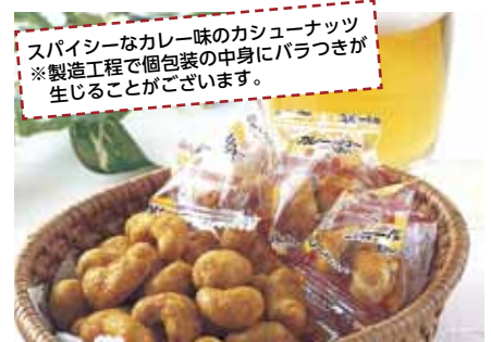
スパイシーなカレー味のカシューナッツ ※製造工程で個包装の中身にバラつきが生じることがございます。