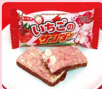
見た目もかわいい、いちご味のブラックサンダー

オリジナルチョコレートを使った濃厚生地にいちご味のミルクレープなチョコチップをサンドしました。