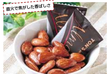
直火で焦がした香ばしさ