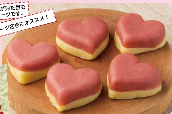
スイーツ好きにオススメ!