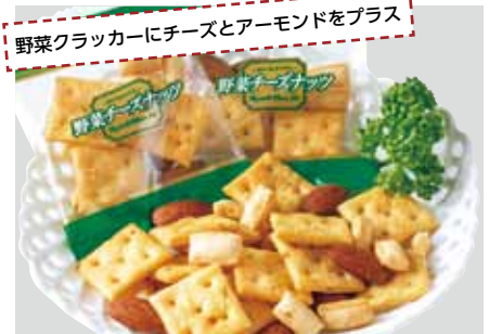
野菜クラッカーにチーズとアーモンドをプラス