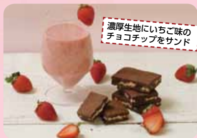
濃厚生地にいちご味のチョコチップをサンド

※新型コロナウイルス感染症の影響拡大により生産体制が整わず、商品をお届けできない場合や、お届けが遅れる可能性がある旨ご了承ください。