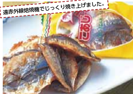
遠赤外線焙焼機でじっくり焼き上げました。