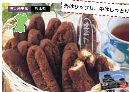
被災地支援 熊本県 外はサクリ、中はしっとり