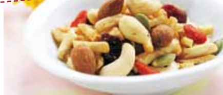
ナッツ・ドライフルーツ・かぼちゃの種の計6種をミックス カシューナッツ・アーモンド・バナナ・クランベリー・クコの実・かぼちゃの種