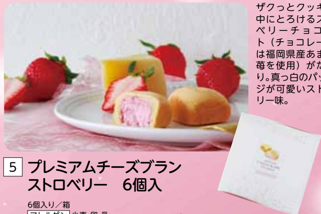
チーズとイチゴのおいしい出会い。